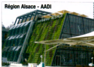
Région Alsace - AADI

L'objectif principal est de promouvoir l'image de l'Alsace et de son savoir-faire architectural en s'appuyant sur un bâtiment remarquable et premier du concours d'architecture organisé par la Chine pour l'espace Urban Best Practices Area (parmi 200 projets), et une scénographie qui présente une image de l'Alsace intemporelle et de sa modernité dans les domaines tels que les transports, le défi énergétique et l'innovation.